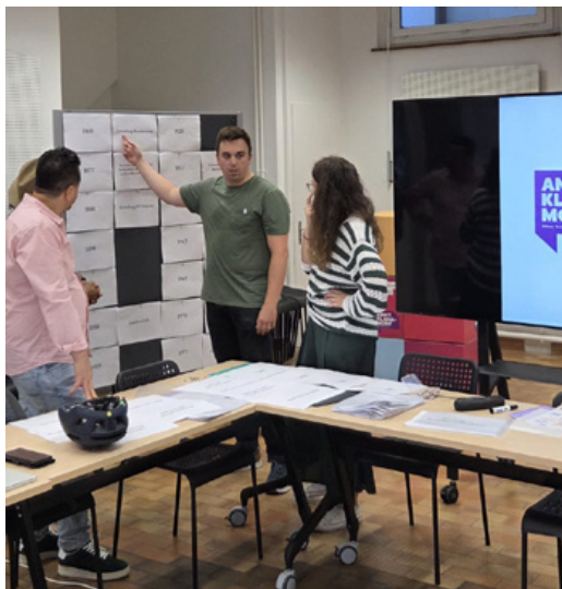
Séminaire sur l'histoire et les fondements de la social-démocratie. 6 septembre 2025, Berne.