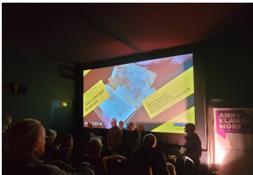
Avant-première du documentaire « Das Lied der Anderen » avec une discussion. 1 er février 2025.